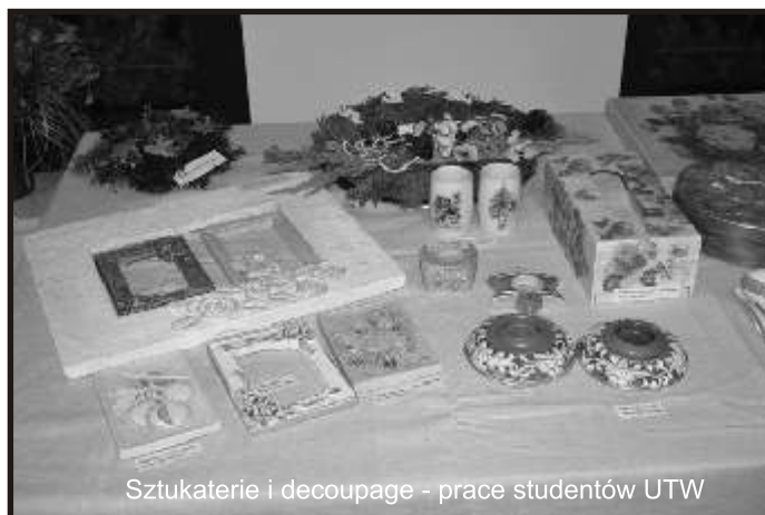
Sztukaterie i decoupage - prace studentów UTW