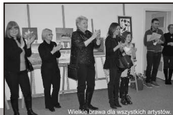
Wielkie brawa dla wszystkich artystów.