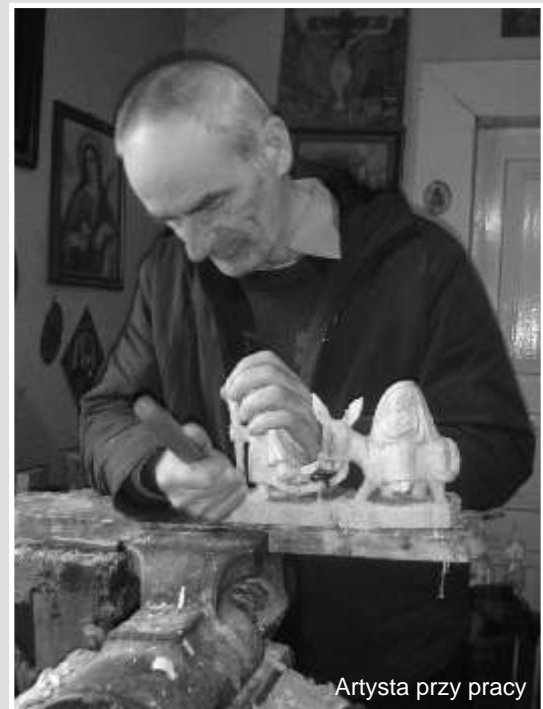
Artysta przy pracy